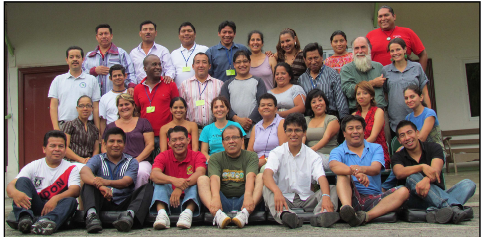
Taller Latinoamericano de Transformación de Conflictos Socioambientales: Se realizó del 7 al 18 de noviembre de 2011. Asistieron 29 participantes (17 hombres y 12 mujeres), de 9 países (Bolivia, Ecuador, Perú, Panamá, Honduras, El Salvador, Guatemala, Cuba y República Dominicana) representando a 23 organizaciones. Más en página 2.